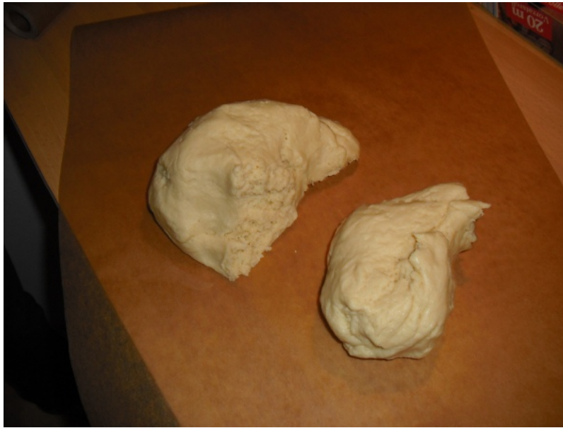
Abbildung 5: Den Teig teilen und einen Teil mit einem Nudelholz auswalzen ( h \approx 1\text{cm} )