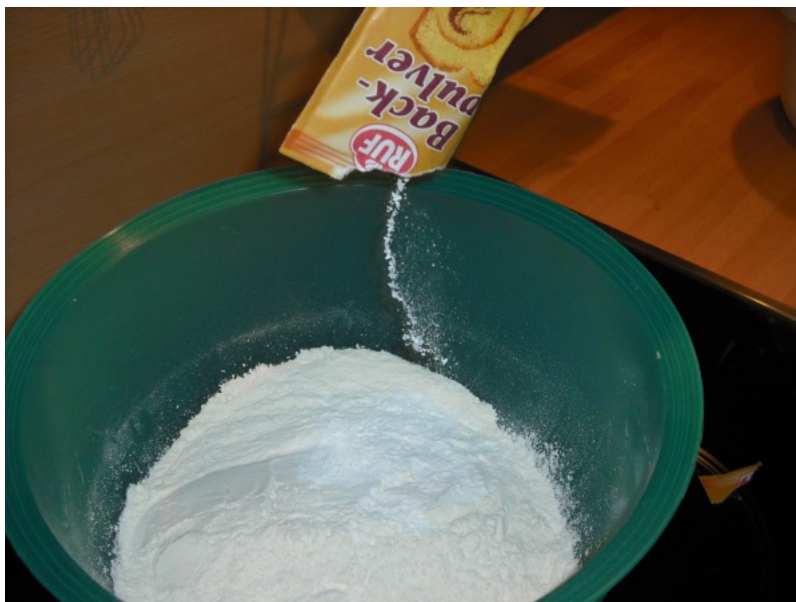
Abbildung 2: Backpulver zum Mehl geben...