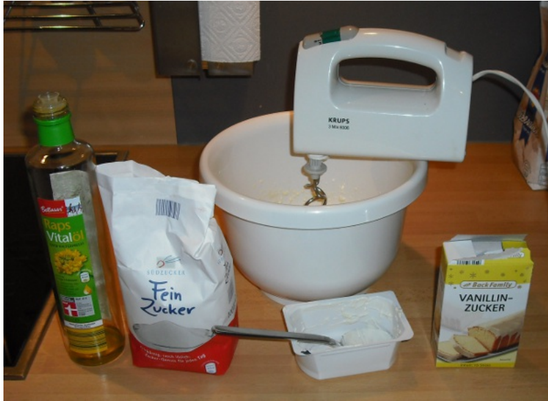
Abbildung 1: Quark, Milch, Öl, Zucker und Vanillezucker verrühren