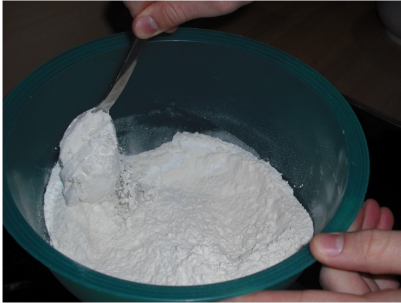
Abbildung 3: ...und vermengen