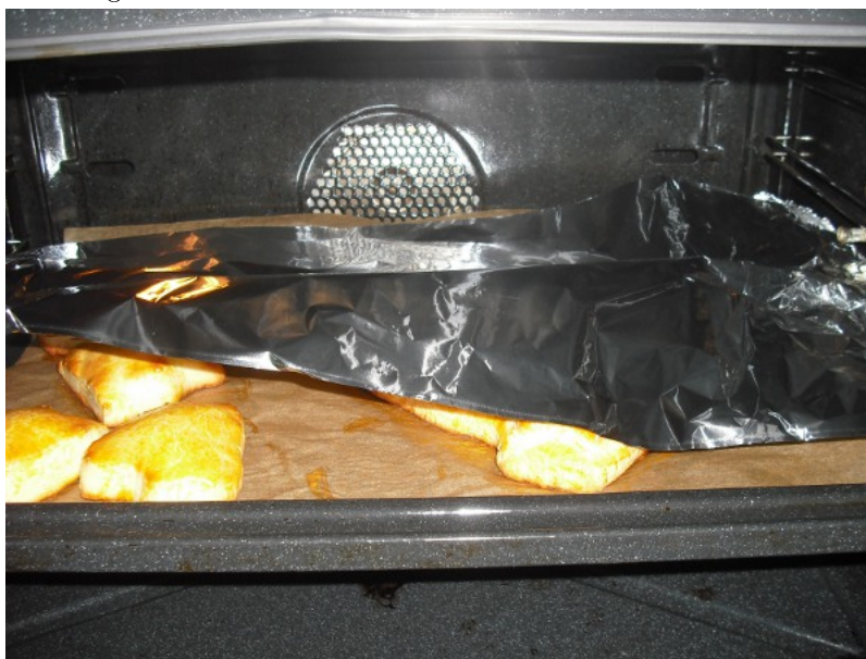
Abbildung 11: Sollte der Tux zu braun werden, kann man ihn mit Alufolie abdecken