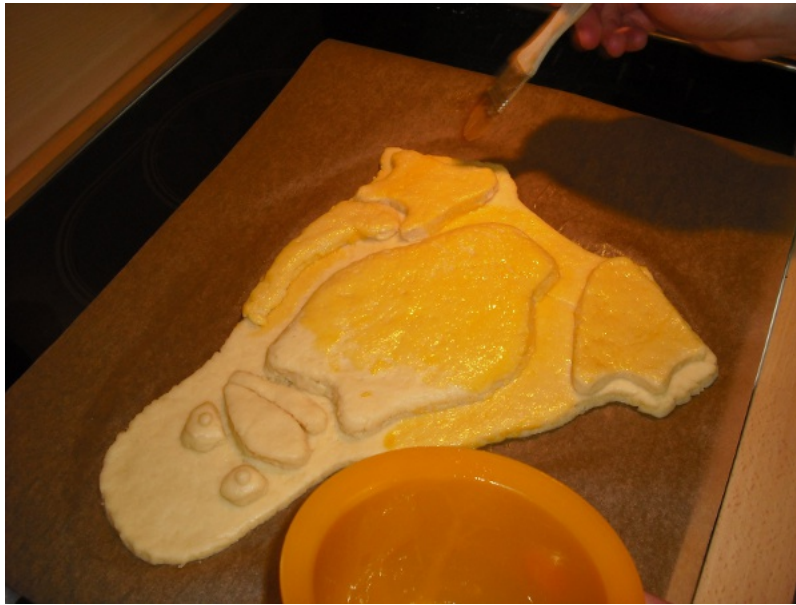
Abbildung 9: ...und mit dem Eigelb bestreichen