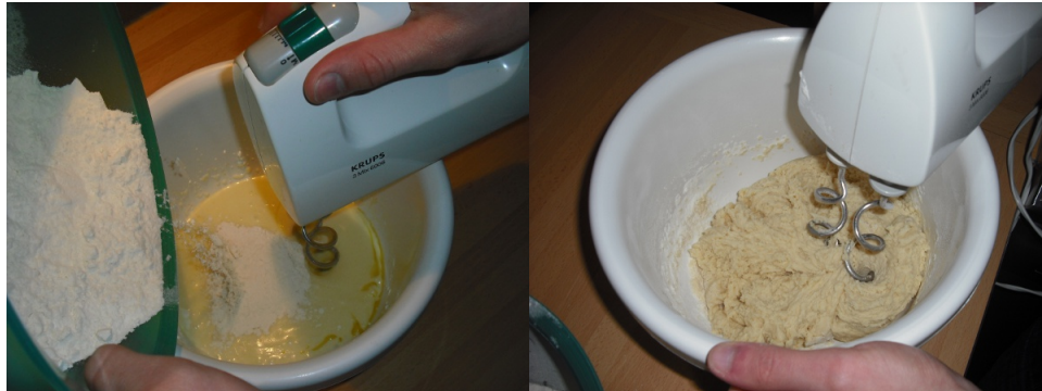
Abbildung 4: Die Mischung nach und nach zum Teig geben und - zuerst mit den Knethaken, danach mit den Händen - verkneten