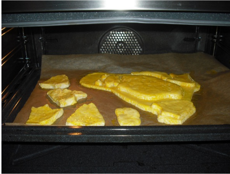
Abbildung 10: Unser Tux bleibt etwa 30 Minuten bei 200° im Backofen