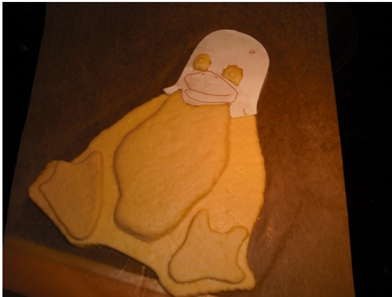
Abbildung 8: Die Körperteile werden nun aufgelegt...